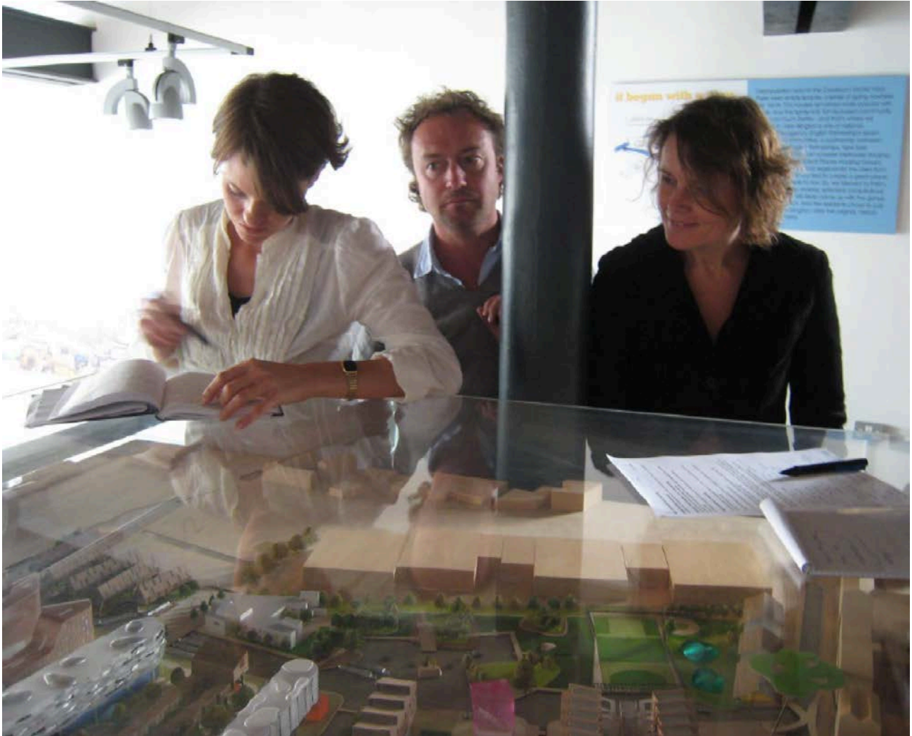
Hold 1. Casestudier i Manchester - besøg hos Urban Splash, New Islington