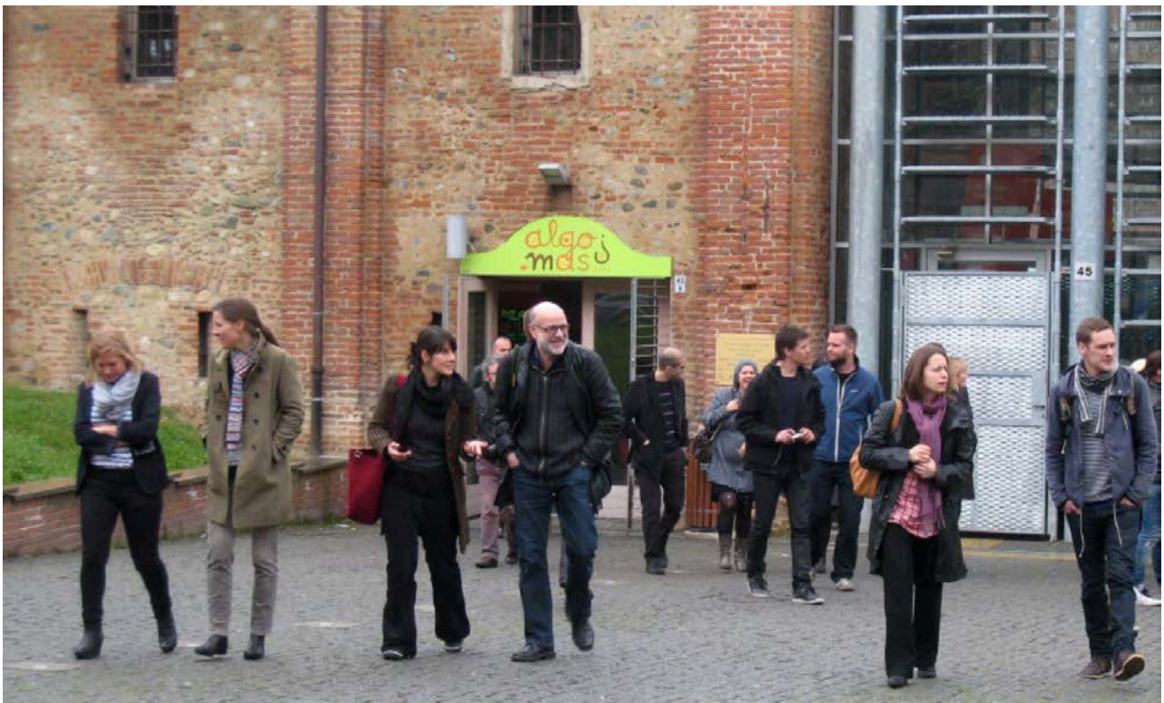
Hold 2. Casestudier i Torino - besøg i et bydelshus i et kvarterløftsområde

Med udgangspunkt i udvalgte tekster med denne baggrund, diskuteres hvordan den aktuelle byplanlægning håndterer de strategiske dimensioner.