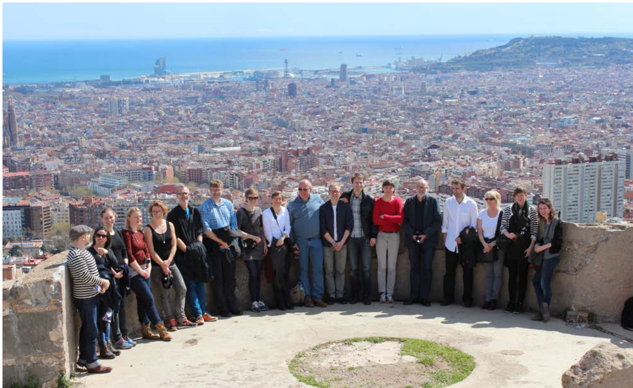
Hold 3. Studietur til Barcelona

Deltagerne udarbejder en rapport som rummer en beskrivelse af udgangssituationen og dynamikken i den pågældende by / område, problemopfattelsen hos dem der har udarbejdet planen og evt. hos andre analytikere eller aktørgrupper, planens indretning og dens relation til forskellige aktørgrupper og styringssystemer, planens implementering og en vurdering / kritik af plan- og transformationsforløbet.