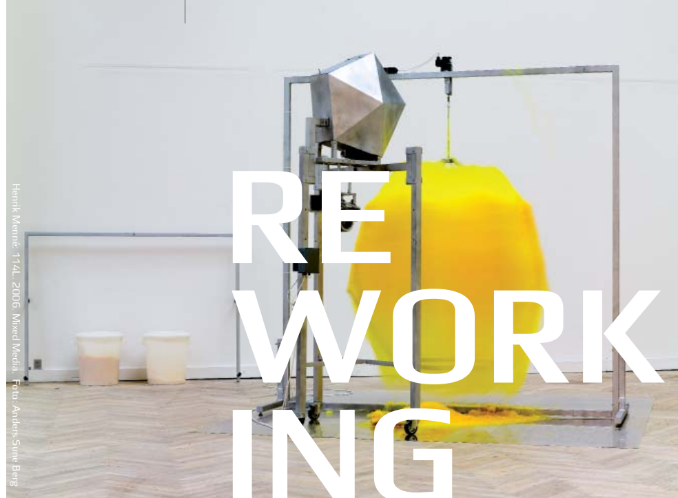
Henrik Wenne - 174L - 2006. Mixed Media.

Det Kongelige Danske Kunstakademi Kunstakademiets Arkitektskole Philip de Langes Allé 10, 1435 Kbh K