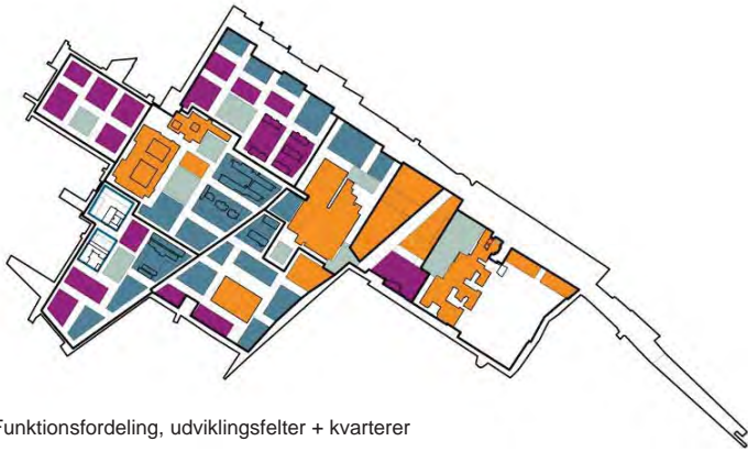
Funktionsfordeling, udviklingsfelter + kvarterer