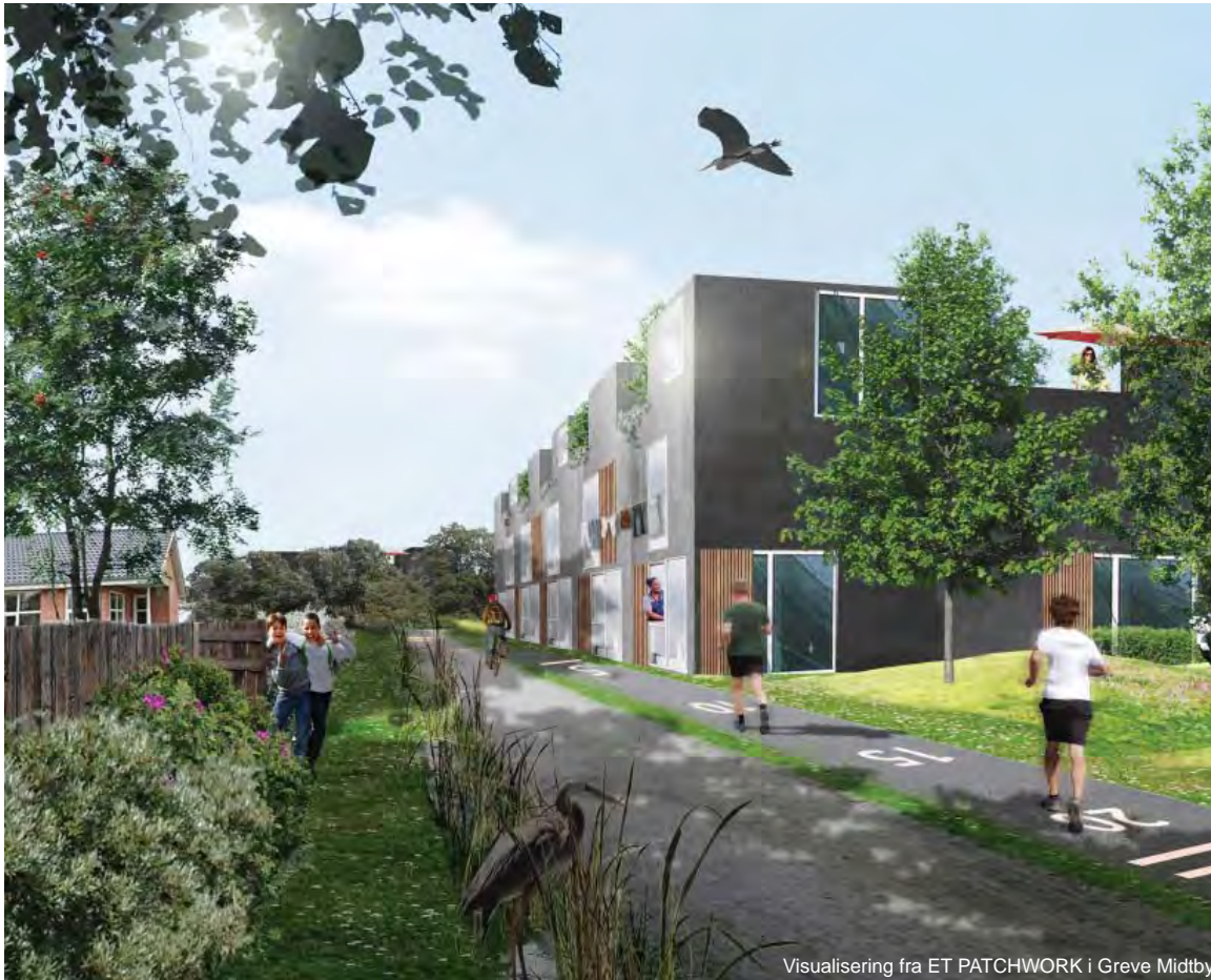
Visualisering fra ET PATCHWORK i Greve Midtby

åbne villaområder igennem kvarterer med små byhuse, inden man når frem til de mere offentlige centerfunktioner.