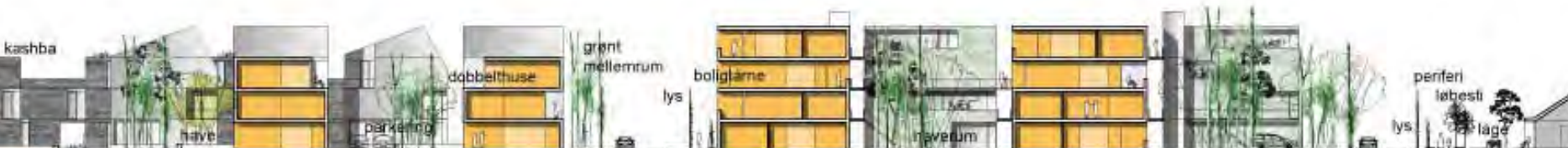
Snit fra ET PATCHWORK i Greve Midtby