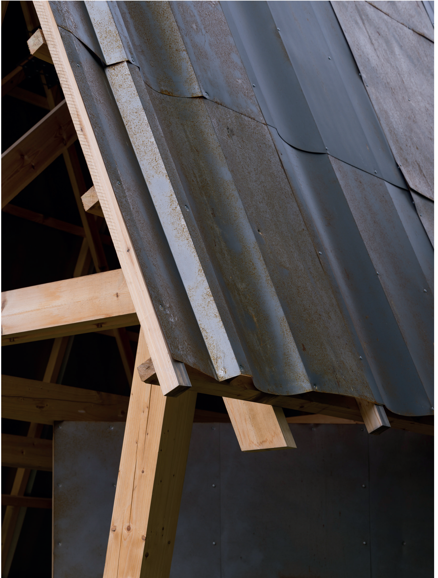
Det Utætte Hus - detalje ståltag