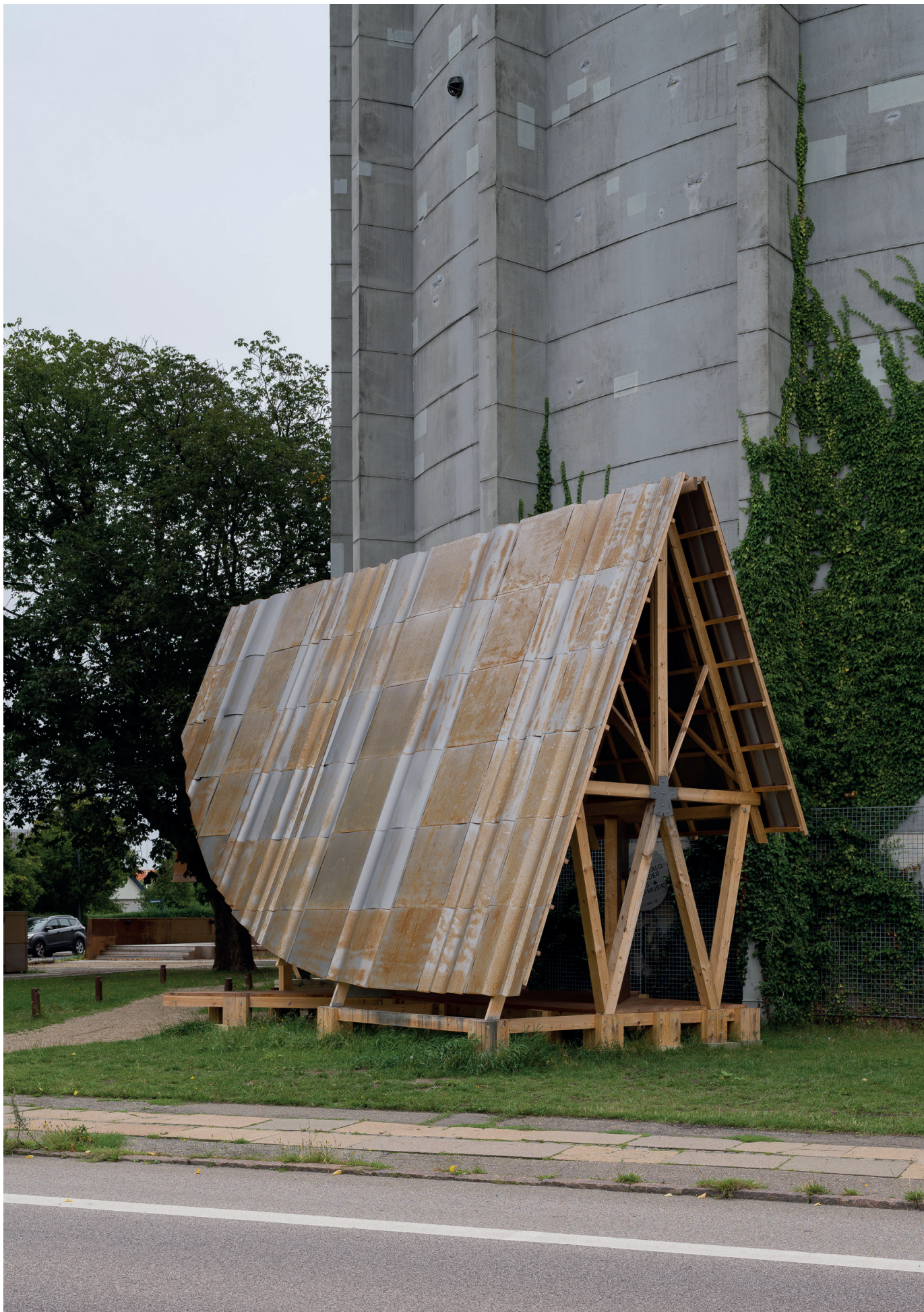
Det Utætte Hus - Gavl 1