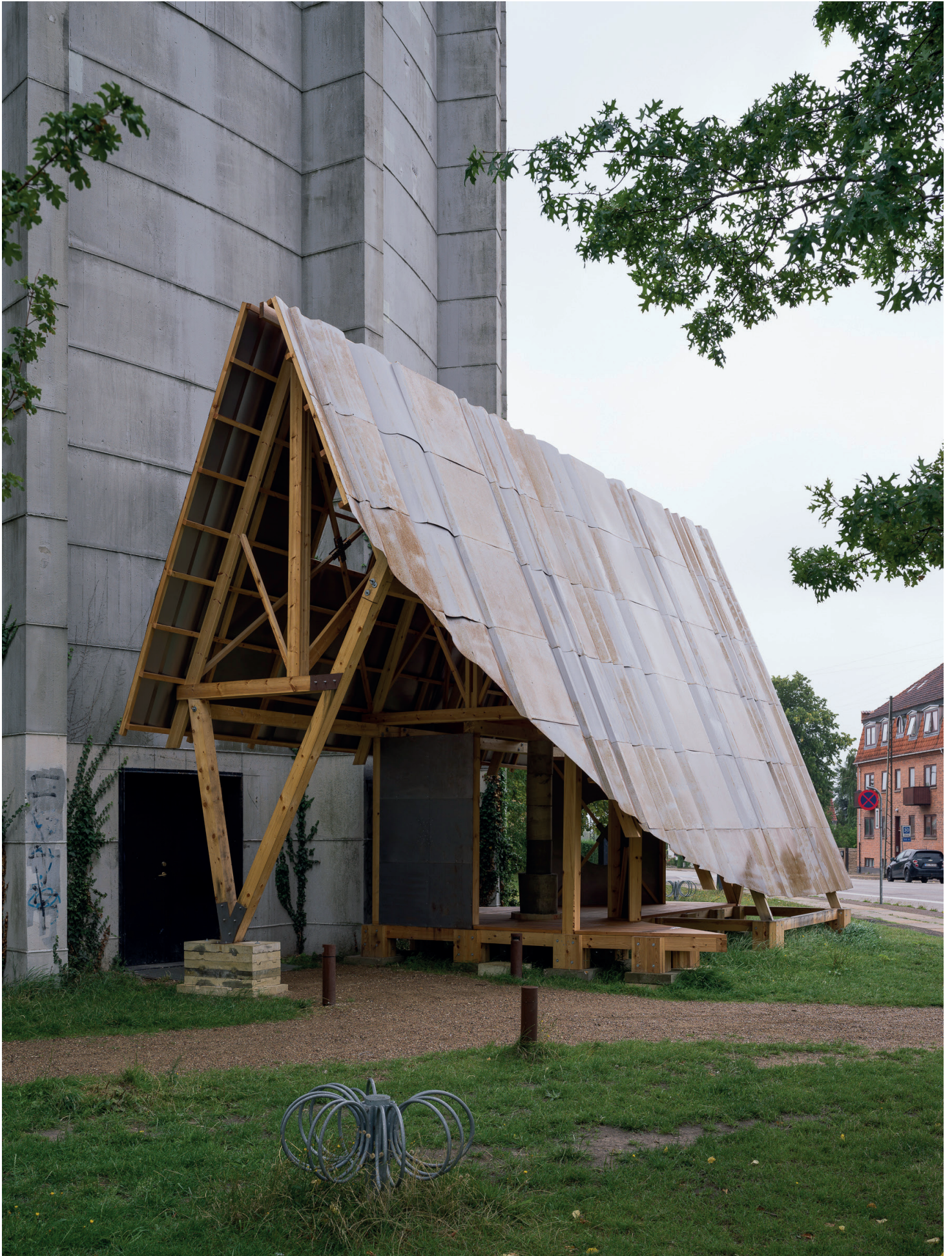
Det Utætte Hus - Gavl 2