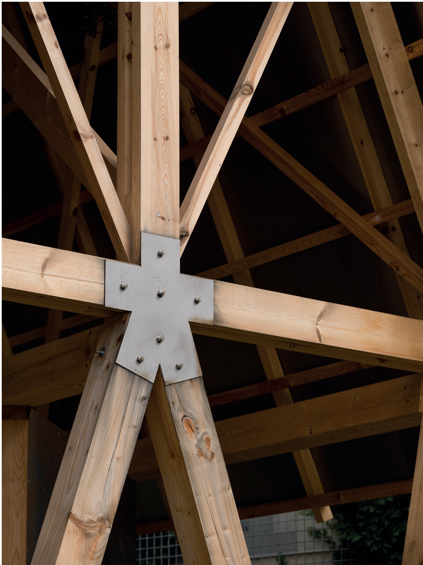
Det Utætte Hus - Gavl 1 detalje stålbeslag, trækonstruktion