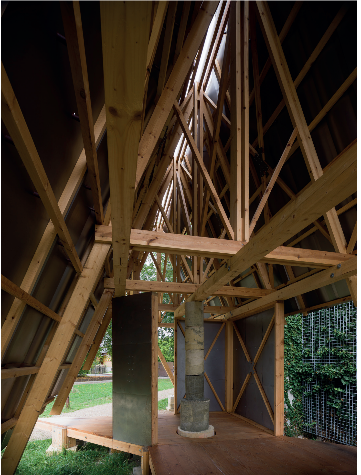
Det Utætte Hus - Interiør - foto af Hampus Berndtson