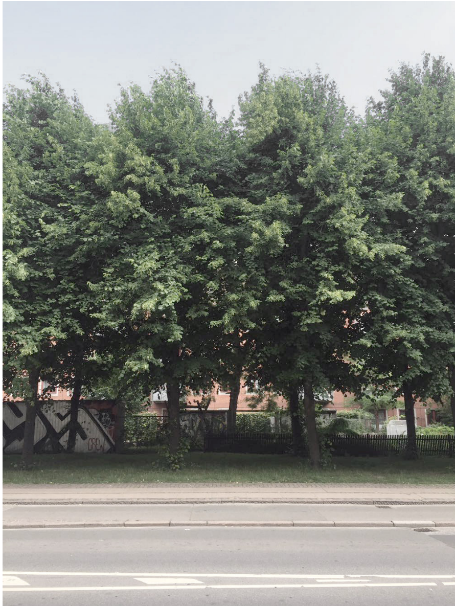
Foto set fra Folkets Park