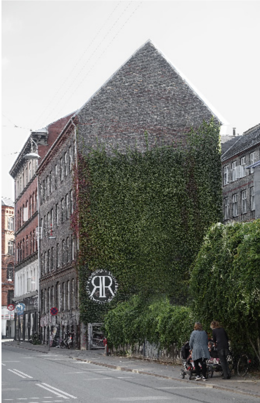
Den gamle fabriksbygning set fra Stengade