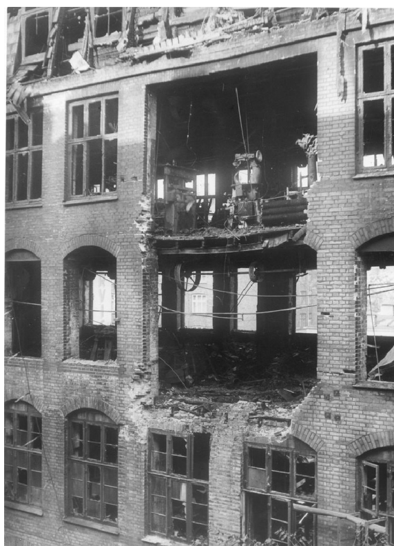
Venstre, arkivfoto af Stengade, ca. 1900 Højre, arkivfoto fra sabotagen, 1944