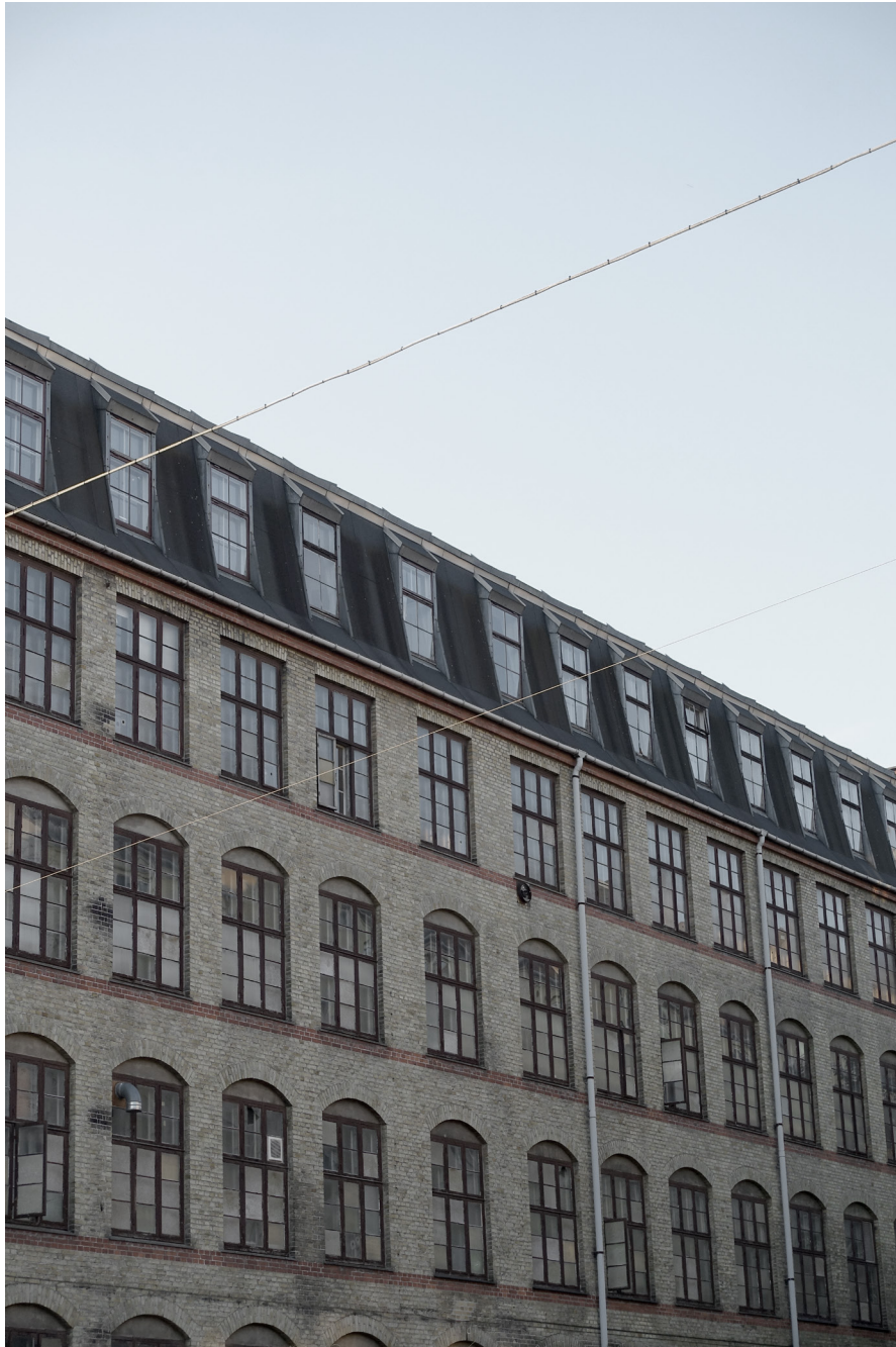
Den nye fabriksbygning set fra Slotsgade