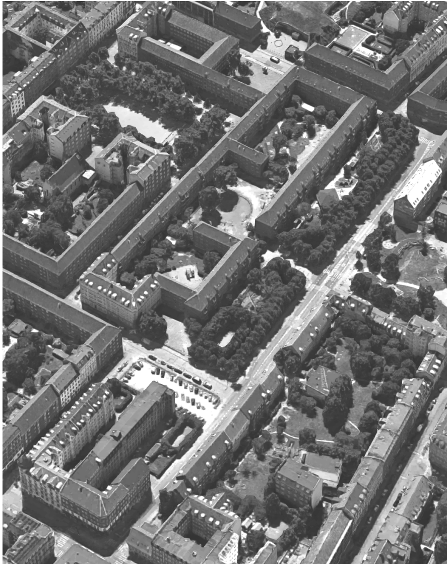
Luftfoto af Stengade