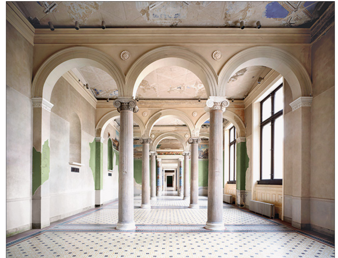
Rekonstruktion af Neues Museum ved David Chipperfield Berlin 2009

Bruges om noget der er genbrugt eller har ændret sig over tid og bærer synligt præg af ændringerne. Noget som består af flere forskellige lag under overfladen.