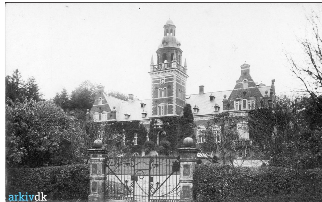
Hesbjerg Slot, frontfacade, 1940

Ophavsretten til denne opgaves indhold tilhører forfatteren Margrethe Kabell Christensen. Anvendelse af materialet er betinget af at der refereres til forfatteren.