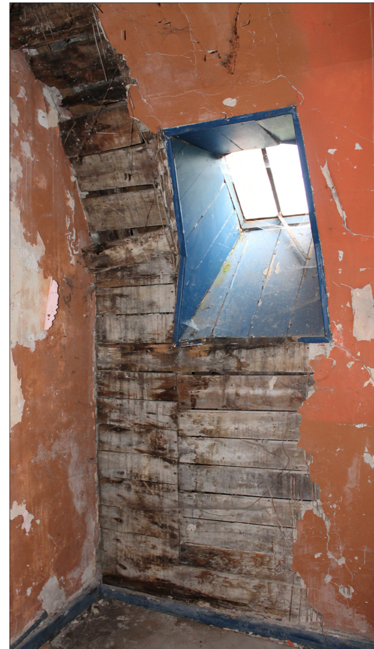
Hesbjerg Slot, 1. sal, 2015

Huset har været uopvarmet og utæt gennem mange år, og dette har naturligvis sat sine afslørende spor. Overalt i huset findes skimmelsvamp på både yder- og indervægge. Flere steder har større vandskader forårsaget råd, som har udviklet sig til gennembrydninger i etagedæk og skillevægge. Huset er koldt og klamt og samtlige vinduer er utætte. Eksisterende forhold vurderes som ikke beboelsesegnet.