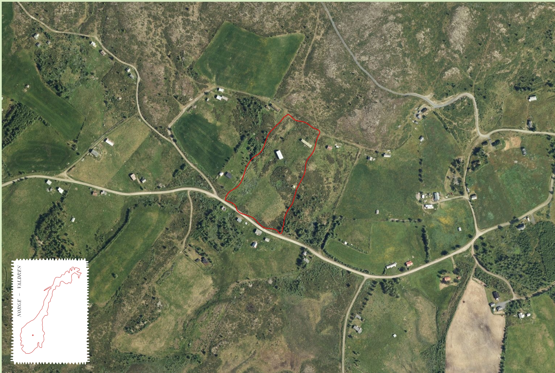
Setermiljøet på Nørre Trøllhøvd, Kartverket