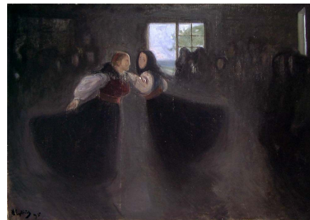
Halfdan Egedius, Dans i storstuen , 1895