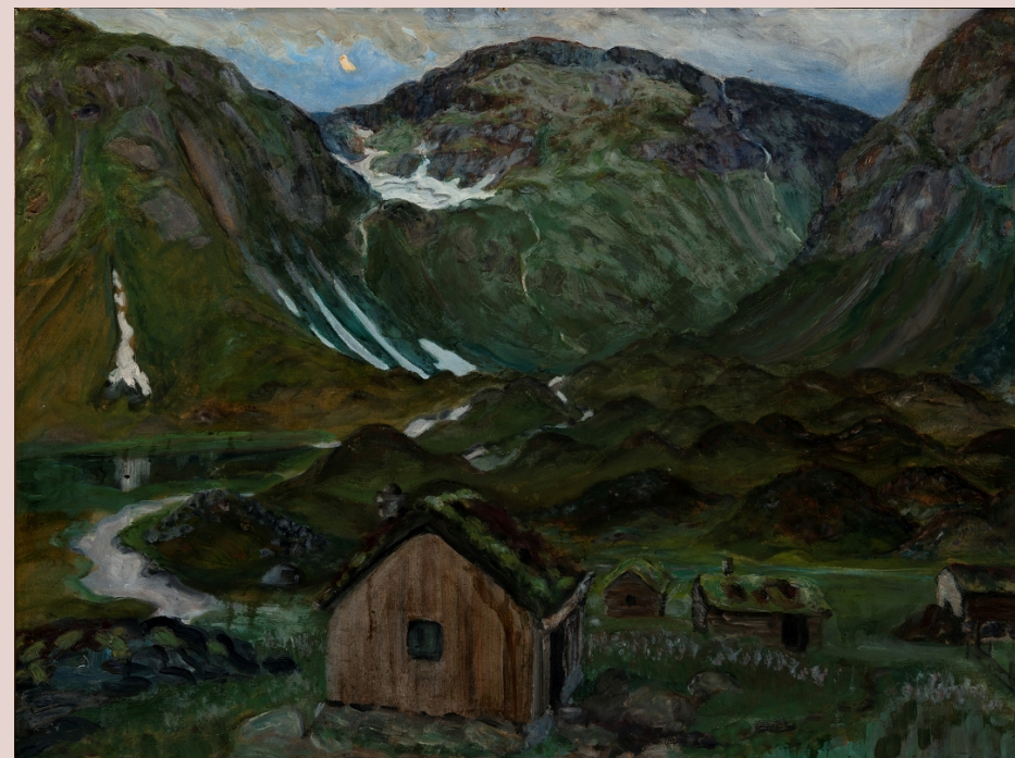
"Seter i måneskin" Nikolai Astrup