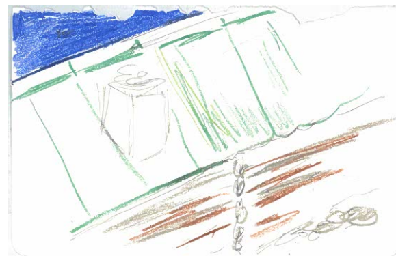
Skisse fra Setra

Setra er ikke i bruk i dag, verken til landbruk eller fritidsbruk. Bygget er ikke fredet, da svært få seterbygg har en fredning eller et vern som sikrer de kulturhistoriske verdier.