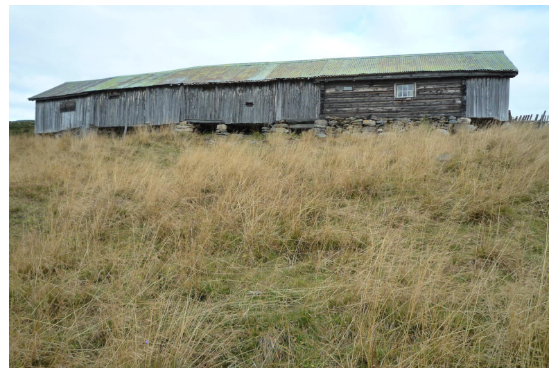
Setra på Nørre Trøllhøvd i Vestre Slidre Kommune