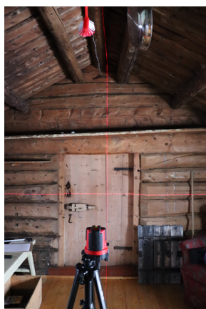
Oppmåling på stedet

Arbeidsprosessen deles inn i 3 faser; blik, kast og prosjekt. Denne metoden er utarbeidet av KTR og vil understøtte prosjektets utvikling.