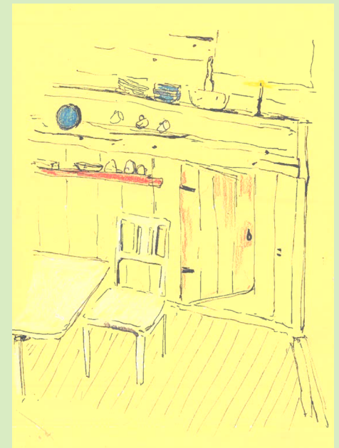
Skisse interior, Nørre Trollhøvd

Avleveringsmaterialet er veiledende og avhenger av prosjektets utvikling