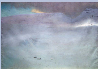
Christian Skredsvig, 1901

Høstingslandskapet var også et mytologisk rom med huldre, vetter og troll. Haugafolk var vesen som i stor grad var knyttet til seterlivet i fjellheimen. De levde i pakt med naturen og tok vare på setra i vinterstid. Luren og bukkehornet, instrumenter som stammer tilbake til middelalderen ble brukt til å lokke og skremme. Denne særlige musikken skapt av disse instrumentene var en kjær tone i seterlandskapet. Overnaturlige vesner, seterekulturen, musikken og fjellet ble et sterk motiv for nordiske kunstnere og forfattere på begynnelsen av 1800-tallet i oppblomstringen av Norges nasjonale identitet.