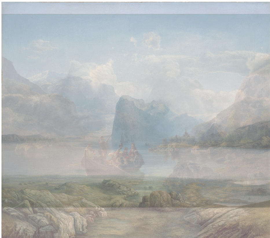
Brudeferd i Hardanger - Adolph Tideman og Hans Gude 1848