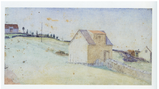
Kat. 35. HVITT HUS I UTKANTEN AV STAVANGER / WHITE HOUSE ON THE OUTSKIRTS OF STAVANGER, 1870–80-årene