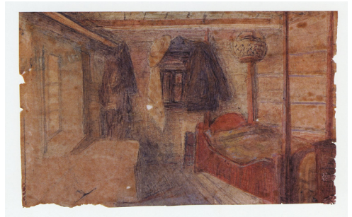
Kat. 39. FARENS VÆRELSE / FATHER'S BEDROOM, 1870-årene