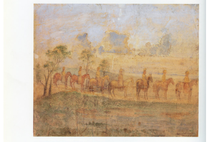
Kat. 52. LANDSKAP MED SJU RYTTERE / LANDSCAPE WITH SEVEN RIDERS, 1880-90-årene