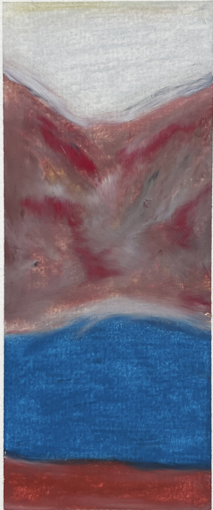
HEMMELIG - HINDE - PORTAL