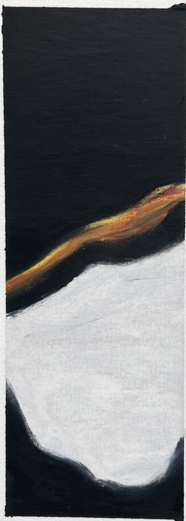
KUL - BRÆNDT - JERNOXID