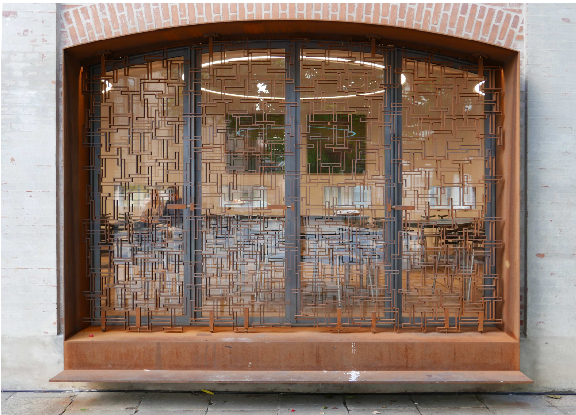
Skærm og indramning, nye spinkle lysekroner, dybde i facaden via refleksioner og spejlinger