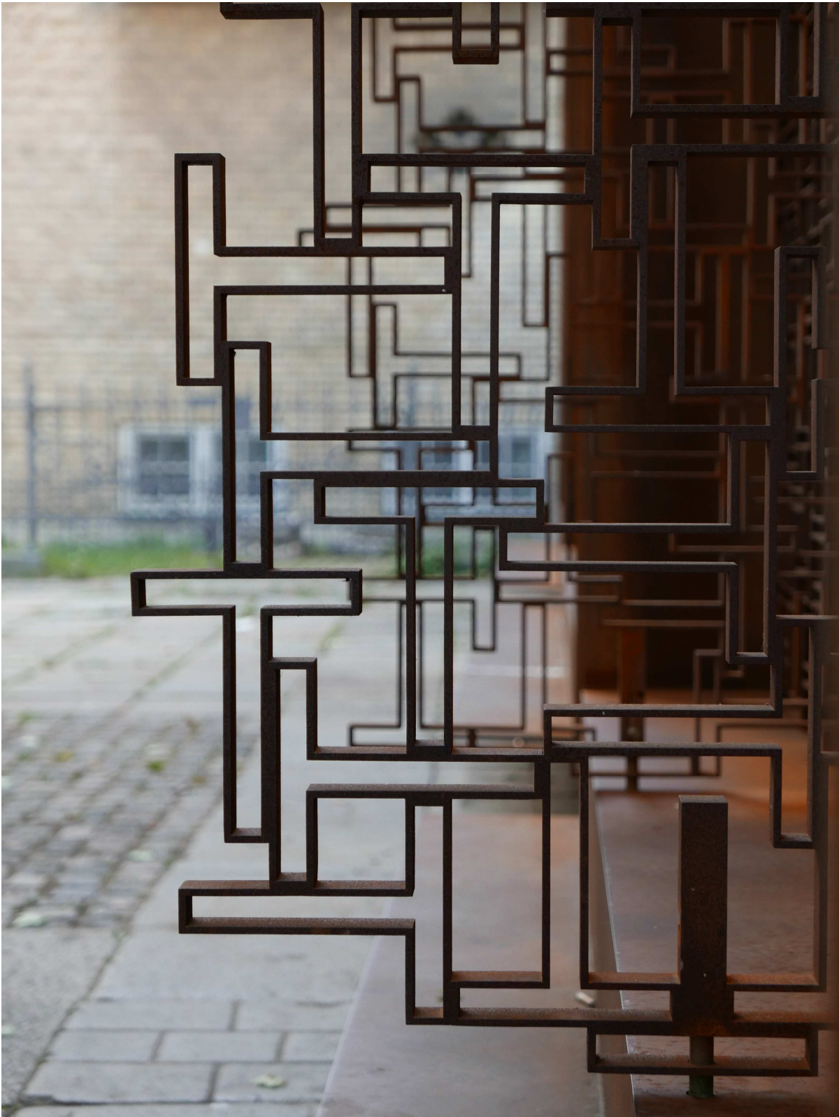
Åben gitterlåge, Terne rækker ud mod omverdenen