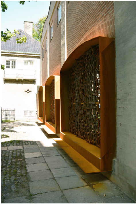
Indramningen med dens forskydninger