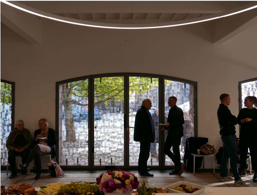
Skærm set indefra med overgangszone mellem semiprivat og offentligt rum