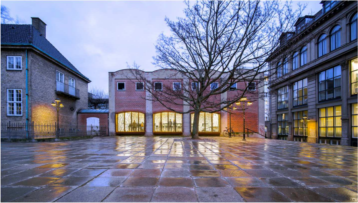
Den nye åbne facade mod kirkepladsen