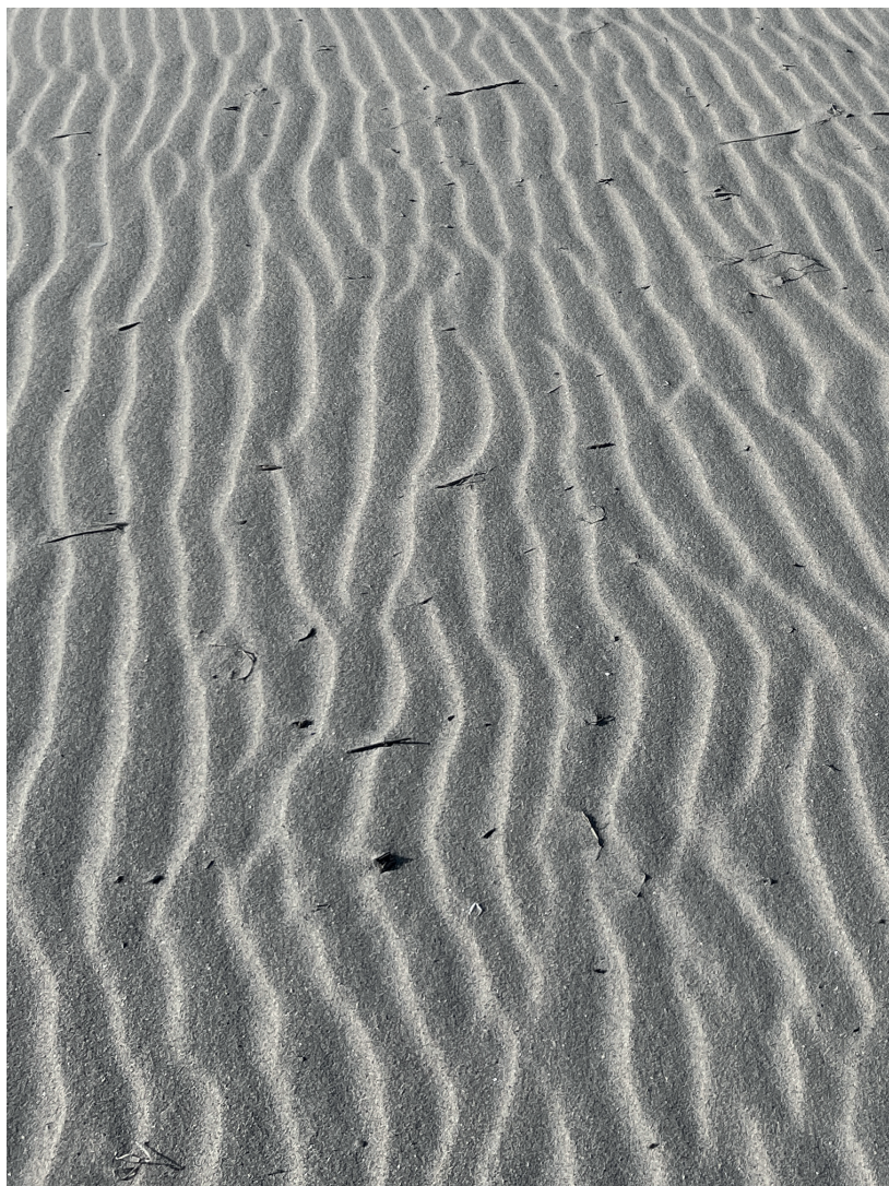
Sandflugt, eget billede, 2022