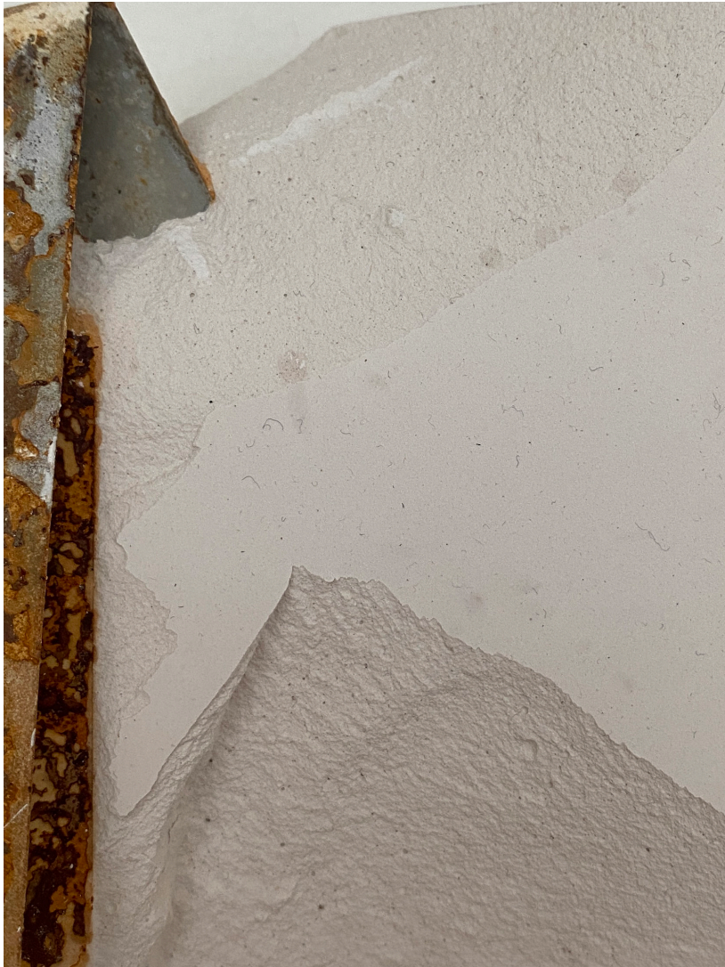
Erosion, eget billede, 2024