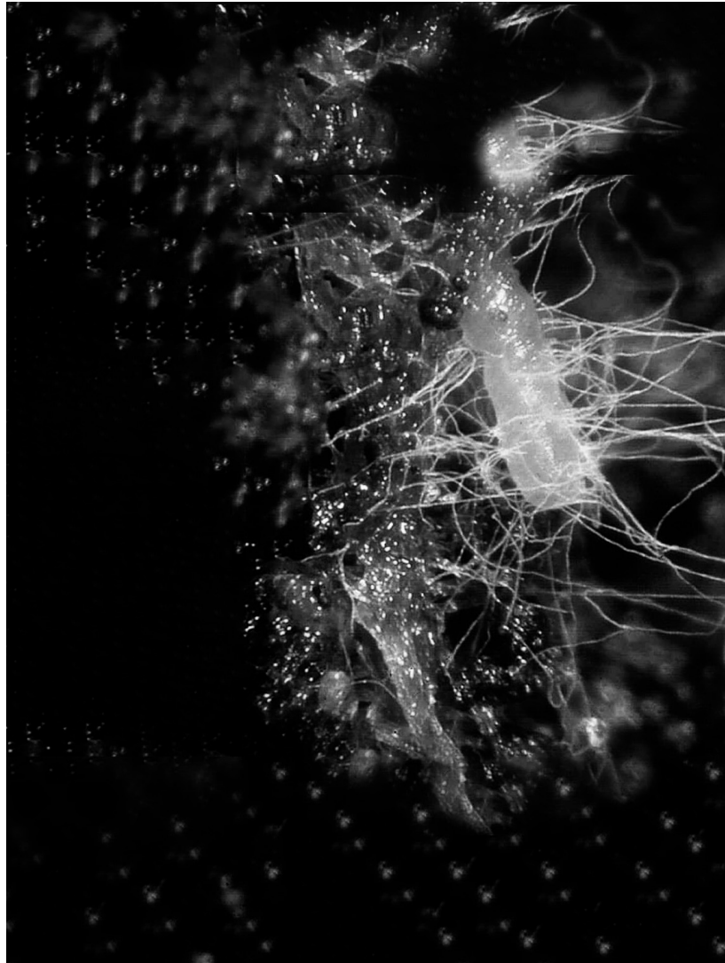
Mycelium, 3 semester