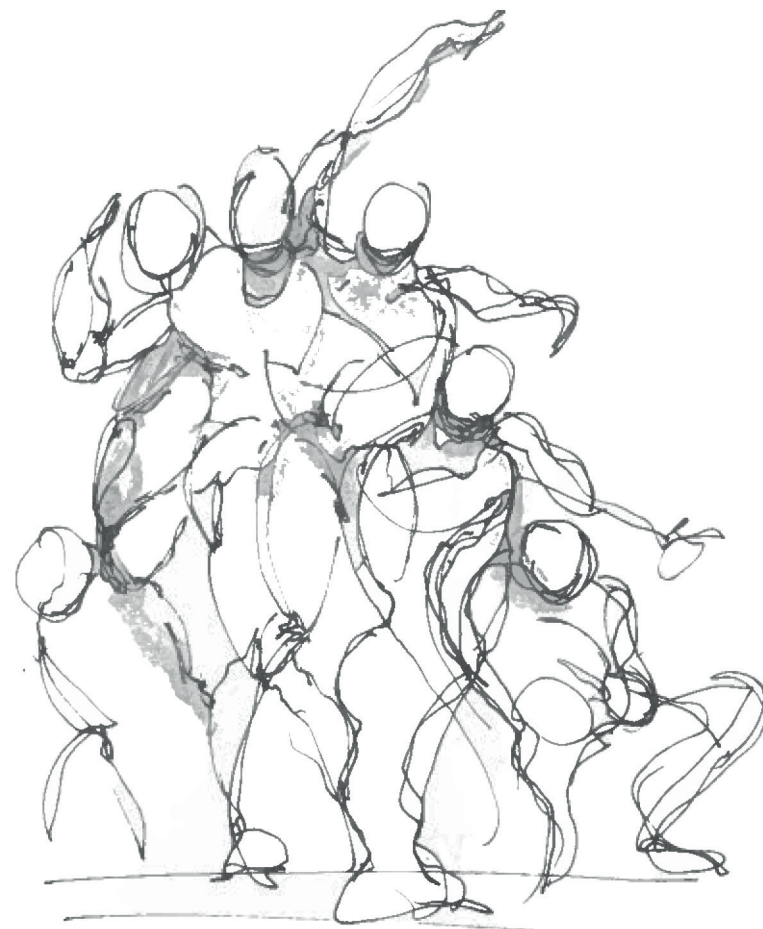
Dynamik, 3 semester

bunden. fri. særegenhed. direkte. fleksibel.