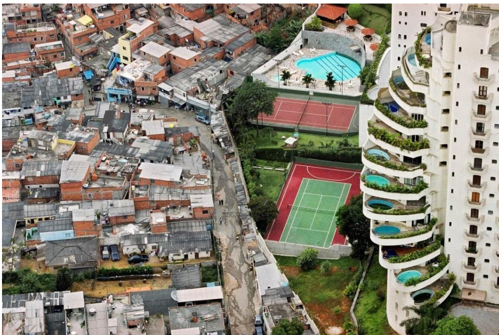
Favela og gated community, Paraisopolis, Sao Paolo, Brasilien.