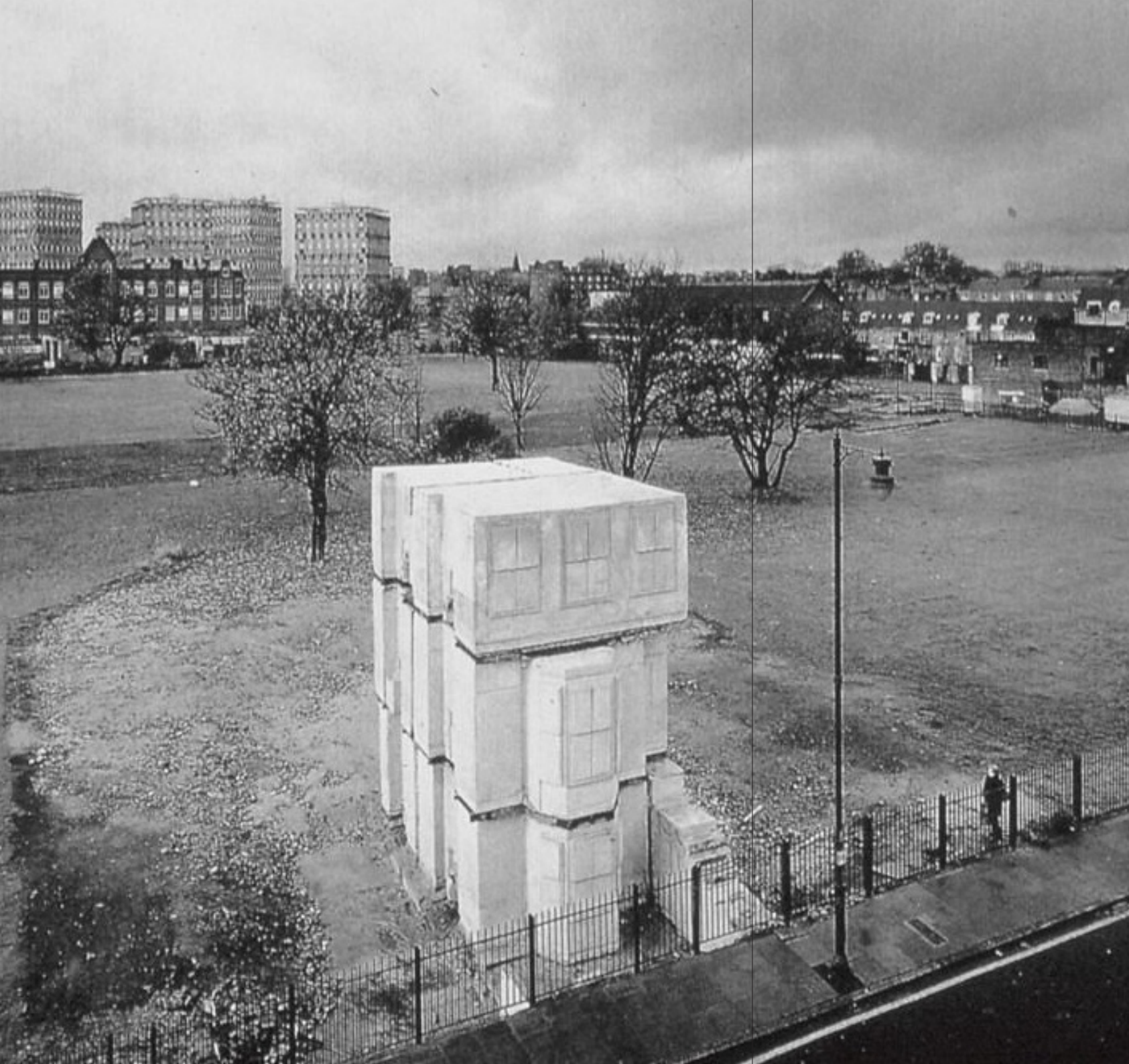
Rachel Whiteread UNTITLED (House) 1993